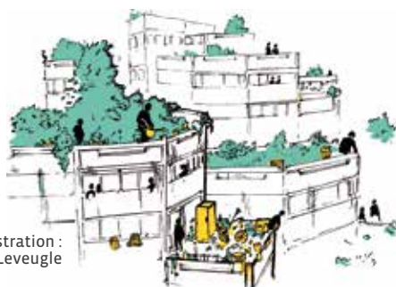
Illustration : Jean Leveugle

À la Maladrerie, si la dégradation des bâtiments est un constat partagé par tous, tous n'ont pas le même avis sur ce site si particulier : pour les uns, l'architecture révolutionnaire de Renée Gailhoustet procure une grande liberté. Pour les autres, elle est une contrainte au quotidien.