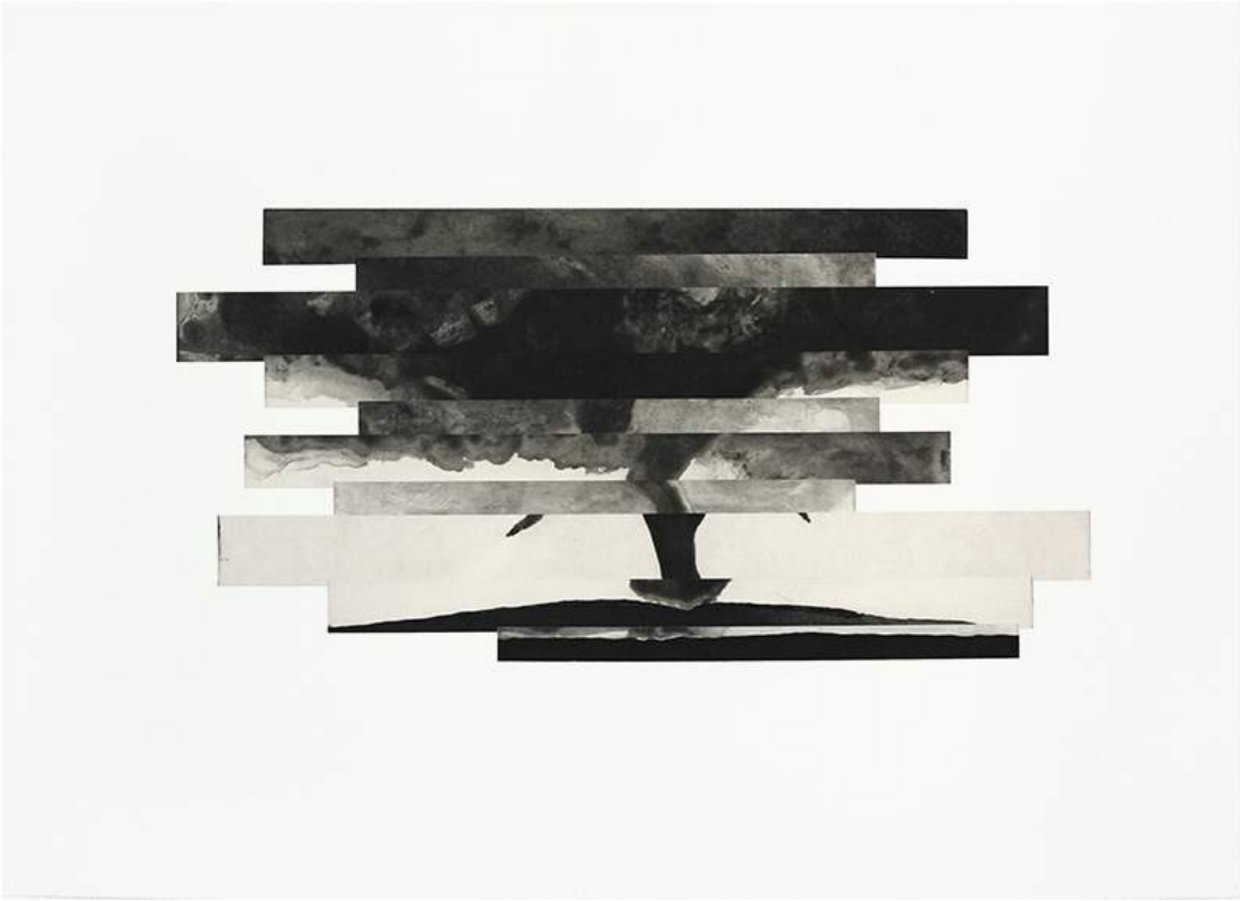
Tornades , lavis à l'acide sur cuivre, 70 x 50 cm; 2017