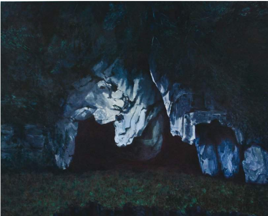
Grotte , huile sur toile, 120 x 150 cm, 2014