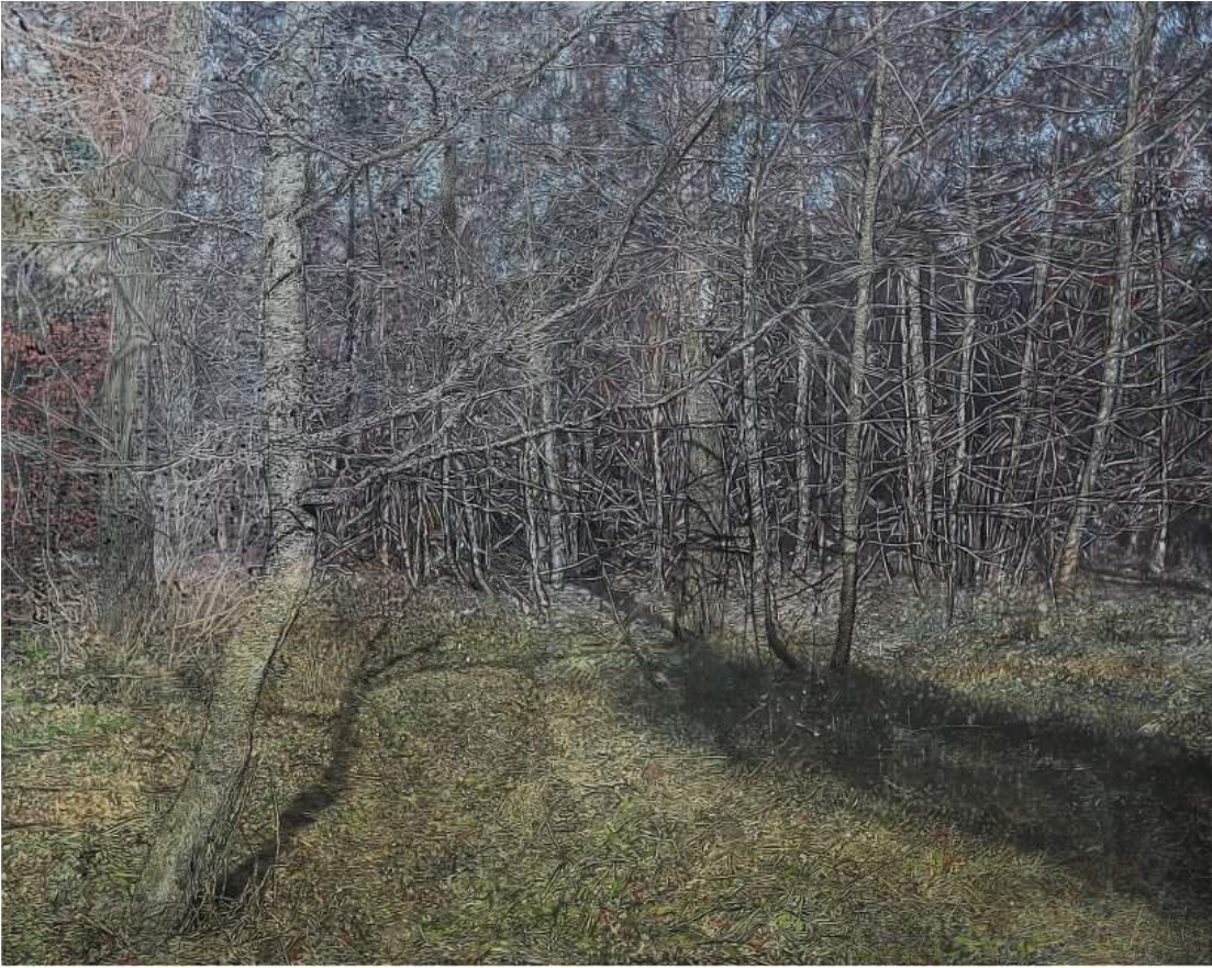
La clairière et l'ombre , technique mixte sur toile, 162 x 130 cm, 2017