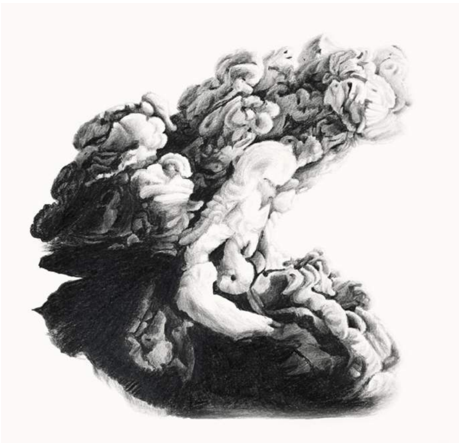
Atomiques , dessin, format variables, 2016