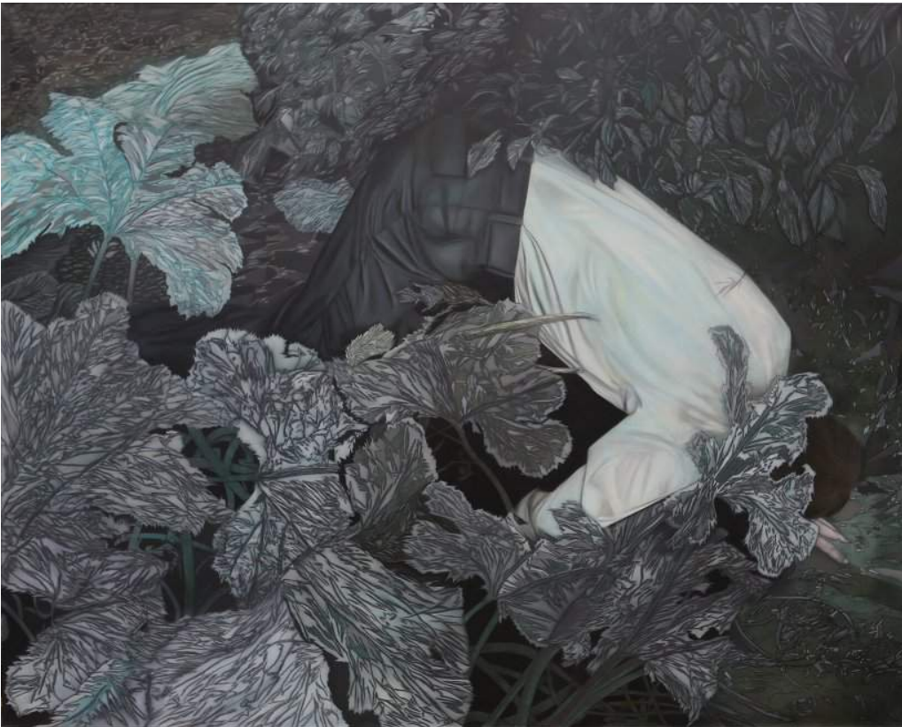
Sans titre , technique mixte sur toile, 162 x 130 cm, 2017