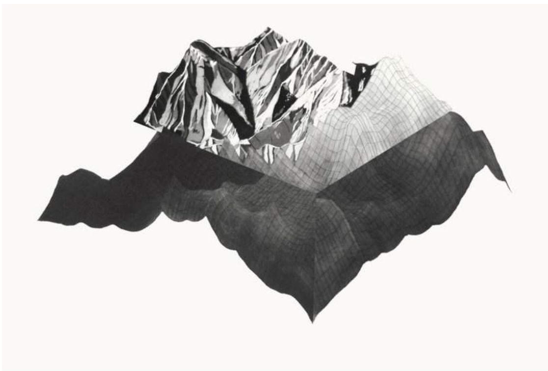
Badlands , gravure, 60 x 80 cm, 2014

« Un tas de gravats déversé au hasard : le plus bel ordre du monde. » Héraclite