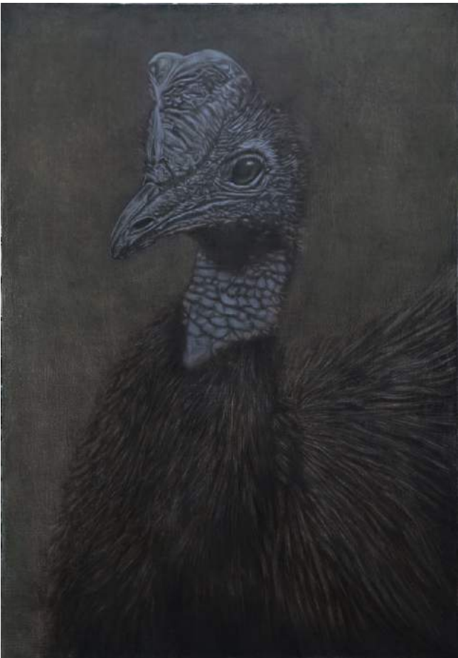
Casoar uniappendiculé , technique mixte sur toile, 92 x 65 cm, 2017