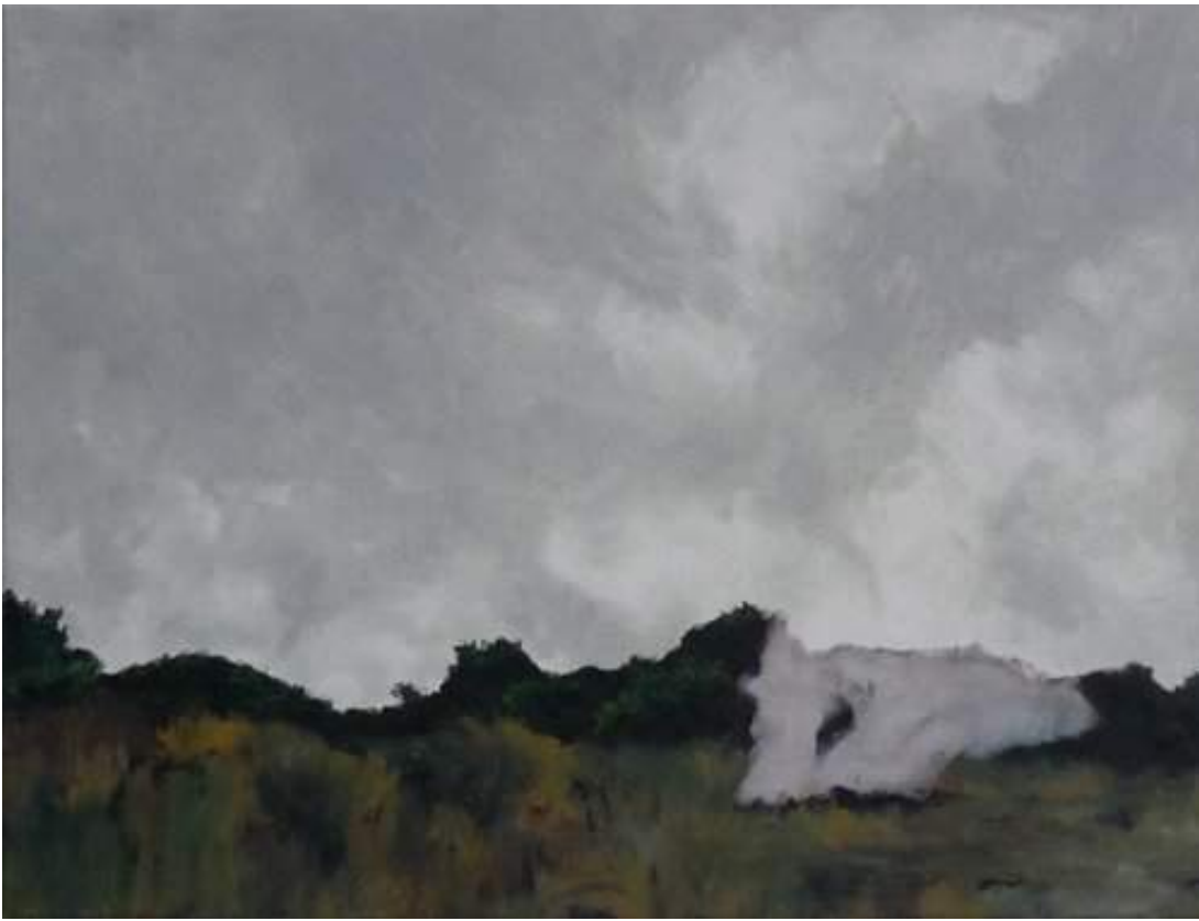
Le Départ , huile sur toile, 38 x 50 cm, 2014